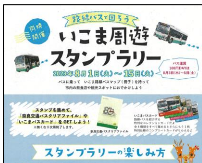
いこま周遊スタンプラリー

今年度 8月と11月、公共交通の全市的利用促進の取組みとして実施した「いこま周遊スタンプラリー」や「バス運賃 100 円 DAY」の内容について共有しました。イベント実施時はひかりが丘住宅線・生駒ニュータウン線の1便あたり利用者数も増加しました。さらには、三者協議やあすか野特別委員会からの提案に対する取組み状況と考え方についても共有を図りました。