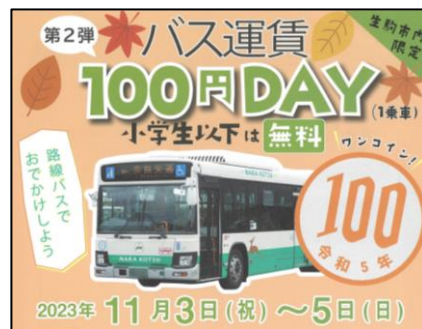
バス運賃 100 円 DAY の実施